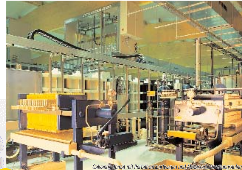
Galvanoautomat mit Portaltransportwagen und Abwasserbehandlungsanlage