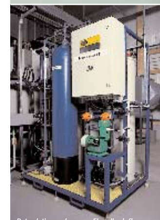
Retardationsanlage zur Eloxalbadpflege