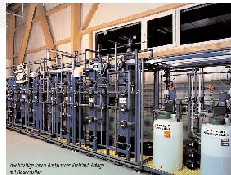
Zwei-straßige Ionen-Austauscher-Kreislauf-Anlage mit Dosierstation